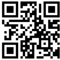
「親子 de 進路診断」 QR コード